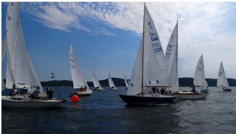
Bild. Folkbåtarna vid SM hos LJSS rundar märket.

Men – efter kyla kommer SM-väder och så även denna gång. Under SM-veckan fr.o.m. onsdag 1 juli t.o.m. söndagen 5 juli var tillfället för sommarsäsongens högsta temperaturer i såväl luft som vatten. Högsta badtemperaturen på 23 gr c strax utanför våra bryggor uppmättes vid detta tillfälle.