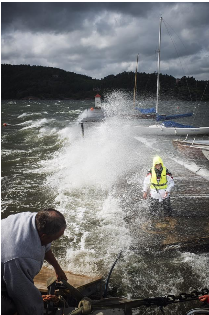
Bild. Blåsiget på Viken efter Andunge VM.

Svar på tal fick en del av dem, vilka hade sina båtar kvar vid vår vågbrytare, under måndagen då en mindre storm slet sönder förtöjningarna för flera av dem. Så var det med de varierande vindarna i Ljungskile.