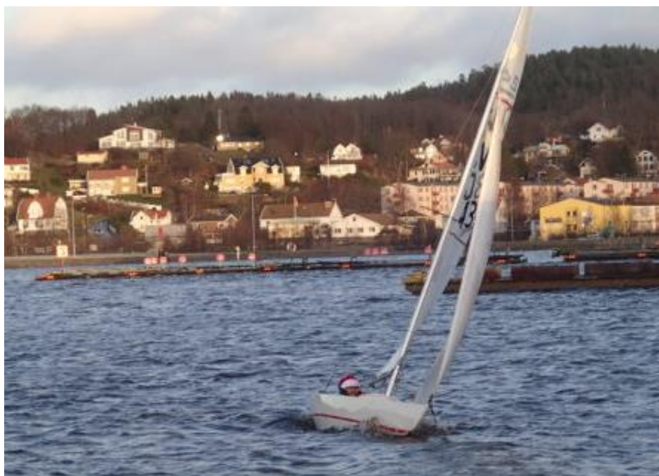
Bild. 2015 års sista segling med 2,4Rm utanför LJSS med tomten som rorsman.