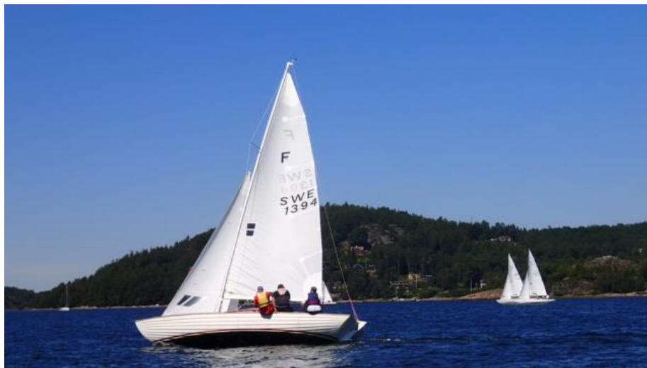
Bild. Svenska mästararna i Folkbåt 2015 mot målet.