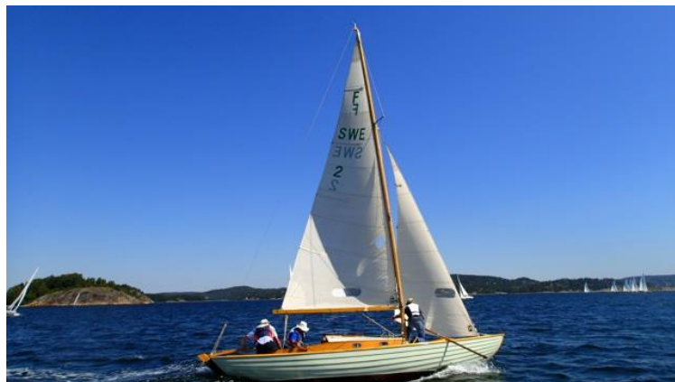
Bild. Världens äldsta existerande, seglande Folkbåt.