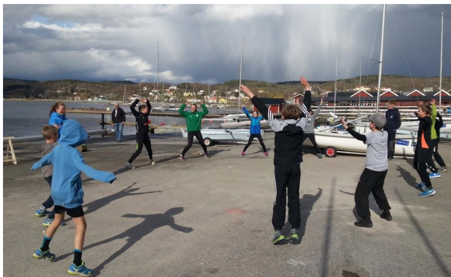
Bild. Fysisk träning för uppstartslägret deltagare hos LJSS 2-3 maj 2015

I år, 2016, går Majbrasan redan på Valborg 30 april. LJSS arrangerar då uppstartslägret direkt i anslutning till Majbrasans avslutning. Övernattning i klubbhuset och en dags rejäl träning på viken för alla Tera och Feva seglare. Grannklubbarna kommer att bli inbjudna. Detta förväntas bli ett perfekt tillfälle att samarbeta med träning och lära känna lite fler seglarkompisar. Välkomna till detta arrangemang.