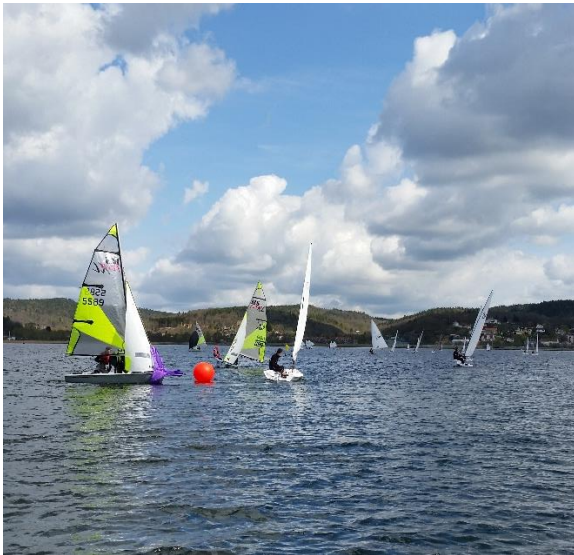
Bild. Länsrundning Majbrasan segling 3.

Tyvär arrangerade Optimistjolleklassen rikskval denna helg, vilket gjorde att flertalet A-optimistseglare uteblev.