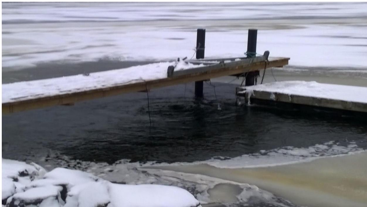
Bild. Effektivt att hålla bryggan isfri genom en eldriven propeller under vattenytan.

Här är några bilder på hur storm påverkar flytbryggorna och hur man kan minska påverkan av is vid bryggorna genom att hålla dem isfria.