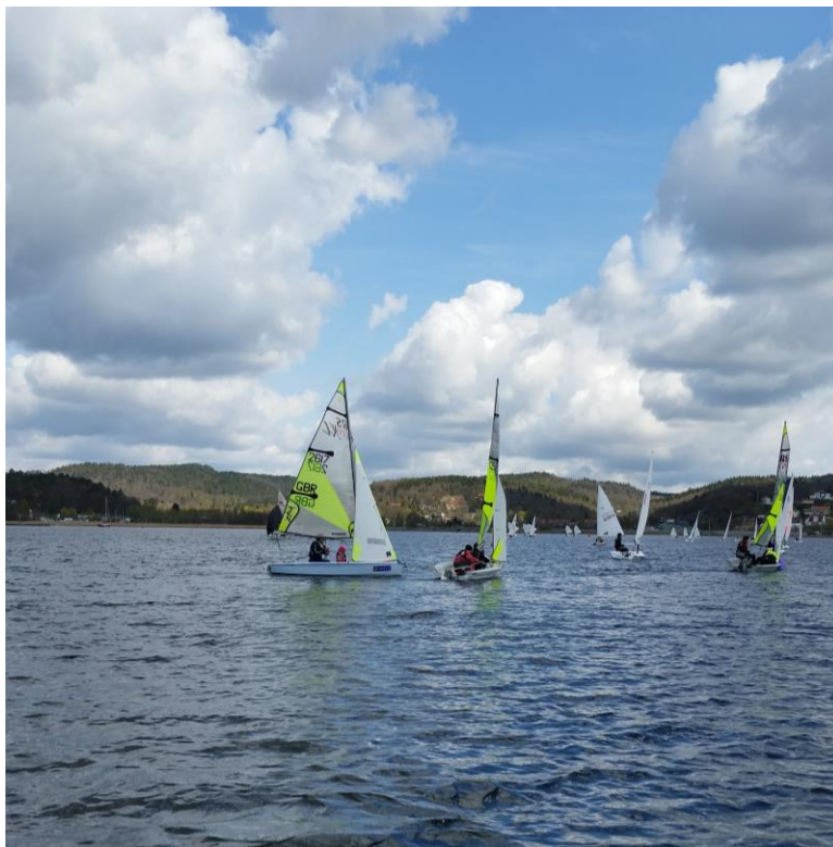
Bild. Länsrundning LJSS Majbrasan 2015 segling 3.