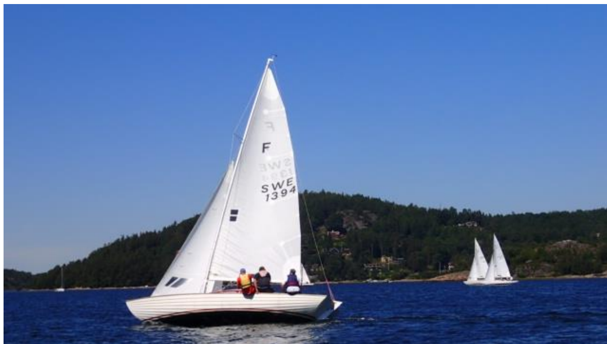
Bild. Svenska Folkbåtmästaren år 2015 vid SM hos LJSS.