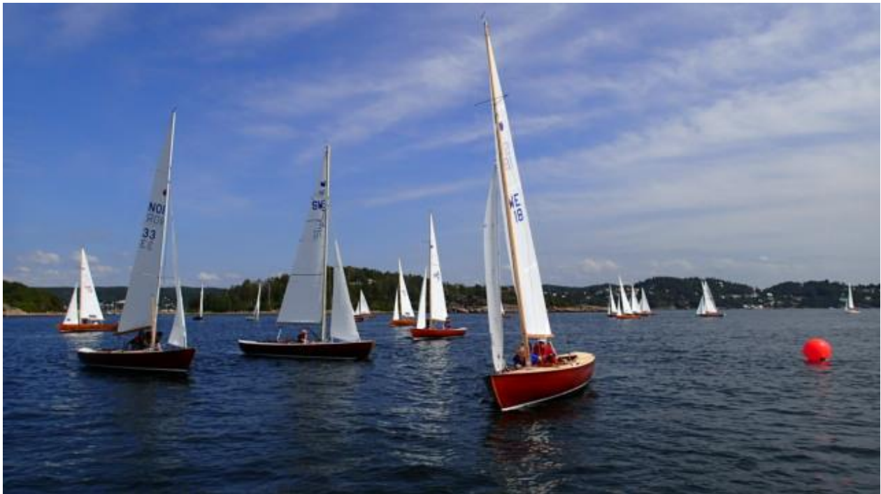
Bild. Vackra Andungar på viken i Ljungskile.

Med 19 st anmälda till Andunge-VM (Västkostmästerskapen) och 17 st på startlinjen varav 2 norska deltagare skådades det därför ett ovanligt stort antal segelbåtar på flaket utanför Ulvön – totalt 52 deltagande besättningar. Häftigt men visst hade det fått vara något mer vind och i stadigare riktning.