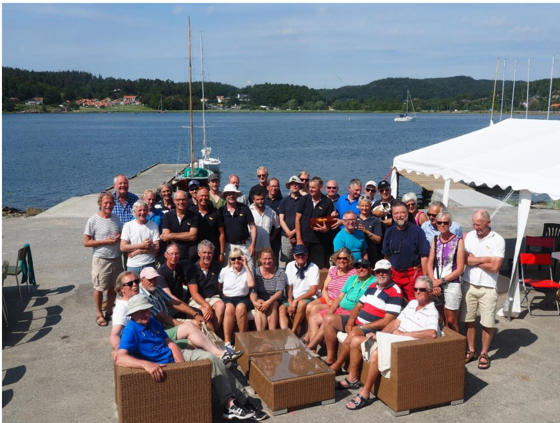
Bild. Rorsmansmöte Andunge VM 2015 hos LJSS.