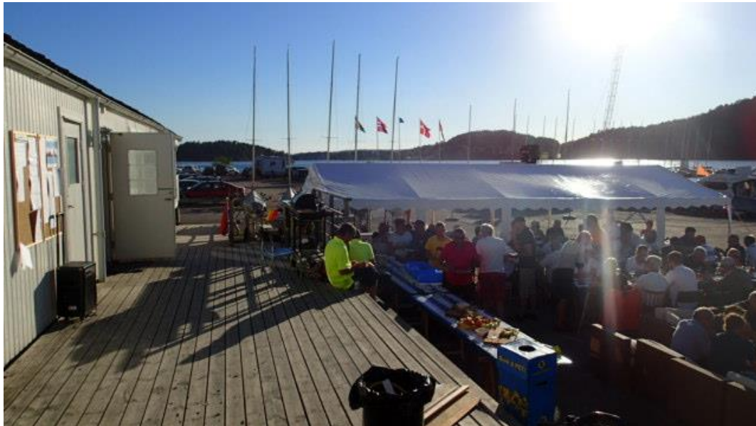
Bild. After sail för Folkbåtsseglare och Andungeseglarna

Deltagarna var klart imponerade över vår förmåga att hitta extra stolar och bord i Ljungskile samt att tina djupfrysta kycklingdelar under intensivt men kontrollerat förfarande.