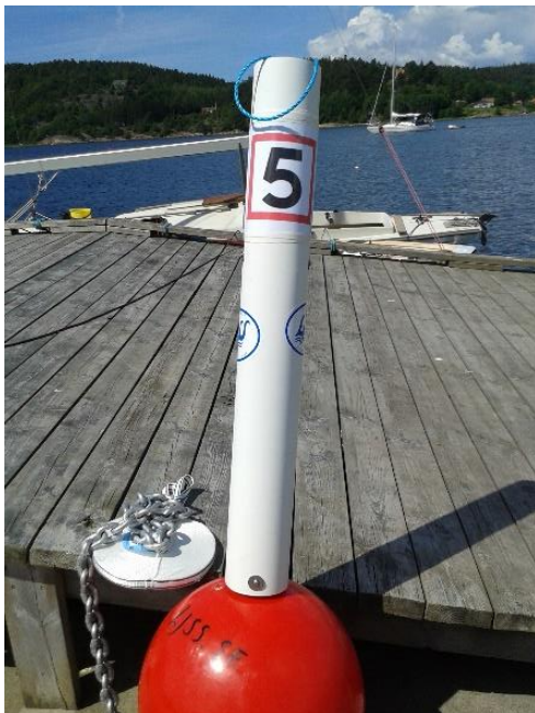
Fartbegränsningsboj 5 knop.