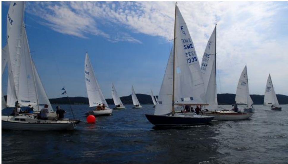
Bild. Folkbåts SM. Rundning

Detta var badveckan 2015 med andra ord. Och flera seglare syntes utan något på sig upptill dessutom. Visserligen präglades veckan av svaga vindar, än dock hann folkbåtarna (28 st) hinna med alla planerade åtta seglingar.