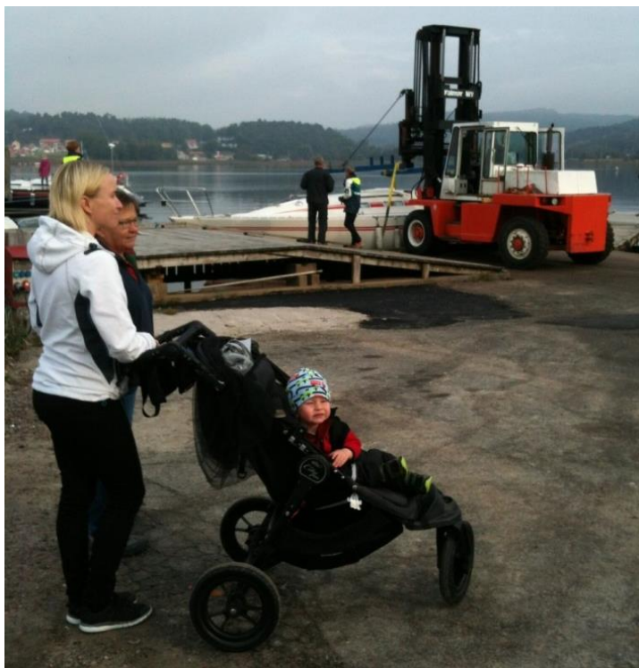
Bild. LJSS truck 2015. Flitigt använd vid SM Tävlingar och sjösättning samt upptagningar vår som höst.

På grund av restriktioner från kommunen pga av misstankar om dålig bärighet på marken så tvingades vi att begränsa utnyttjandet av uppläggningsområdet lite. Detta förde med sig att vi har tagit upp några båtar färre än föregående år. Vi har också packat båtarna lite tuffare för att få fritt 10 m från släntkrön, enligt kravet från kommunen. Jag tackar för att alla varit förstående och accepterat detta.