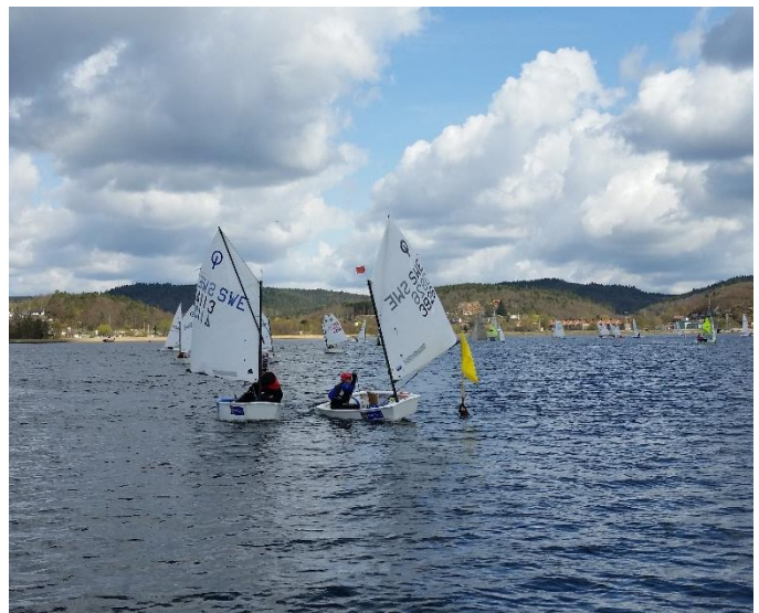
Bild. Länsrundning Majbrasan segling 4.

Totalt blev det dock till slut 32 besättningar i Majbrasan på startlinjen i ett flertal olika klasser. Alla de fyra planerade seglingarna blev av som tänkt dessutom, i den svaga nordnordostvinden.